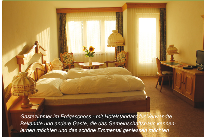
Gästezimmer im Erdgeschoss - mit Hotelstandard für Verwandte Bekannte und andere Gäste, die das Gemeinschaftshaus kennenlernen möchten und das schöne Emmental geniessen möchten

3 Wohneinheiten für Ehepaare oder Familien