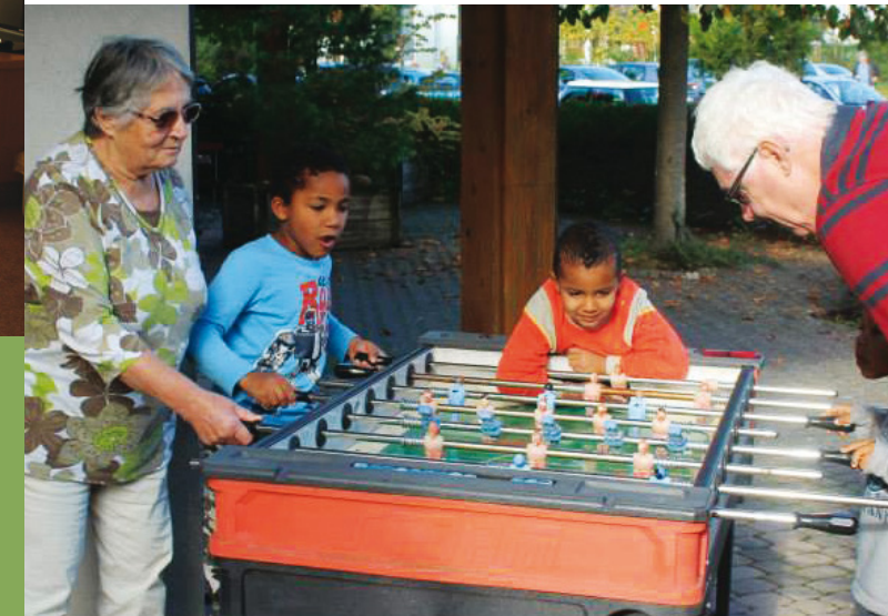
Gross und Klein, gemeinsam versunken ins Spiel

Wer eher Ruhe sucht der findet im Garten und in den Gemeinschaftsräumen schöne Plätze zum Verweilen.