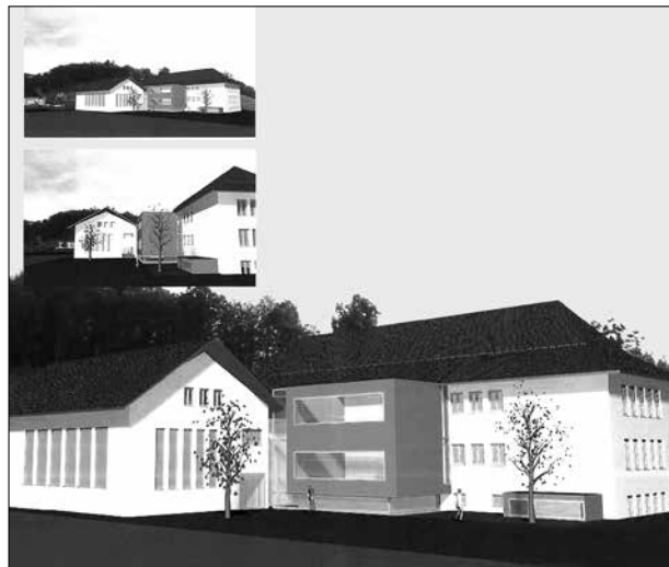
Visualisierung Schulhaus mit Anbau, Pausenhof West

Der Gemeinderat plant einen Orientierungsanlass, welcher wie folgt stattfinden wird: