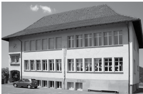
Schule Ranflüh – wohin?

Bis im Herbst 2013 befasst sich der Ausschuss (externe Beratung) mit diesen Fragen und wird das Ergebnis in geeigneter Form öffentlich bekannt geben. In der Arbeitsgruppe sind Mitglieder des Gemeinderates, der Schulkommission und die Schulleitung vertreten.