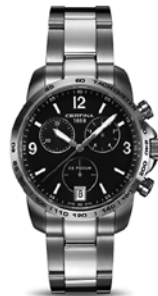
DS Podium - Chronograph