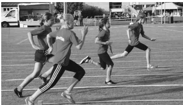
Mädchenriegetag, Rüegsaachsen 2014