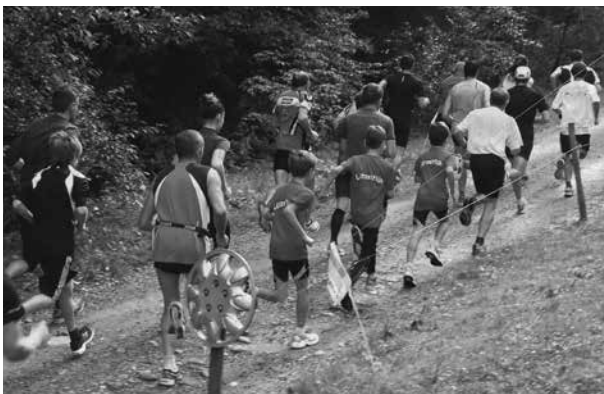
Ringgis-Berglauf, Bowil 3,75 Kilometer, 237 Höhenmeter

Das Leiterteam des TV Lützelflüh-Goldbach