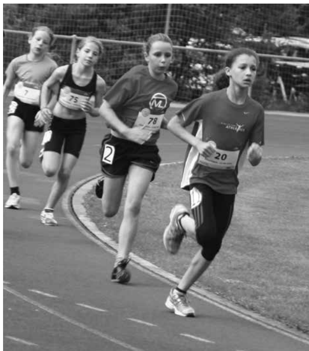
Kantonalfinal Mille Gruyère, Interlaken 2014