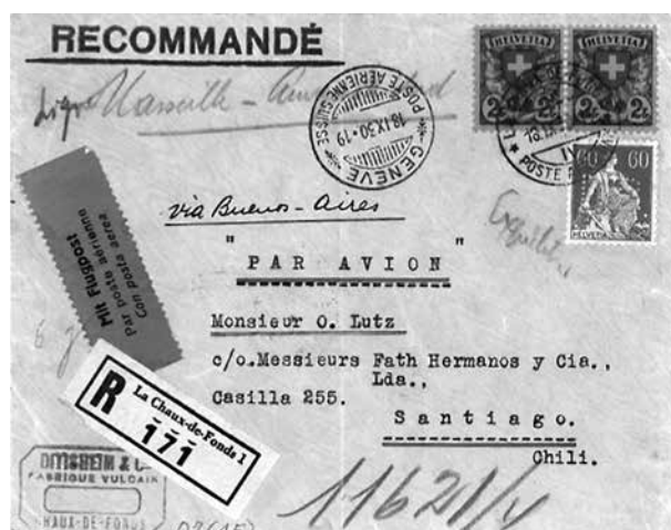
Eingeschriebener Flugpost-Brief mit seltener Destination von Genève über Buenos-Aires nach Santiago in Chile mit Firmenlochung der Firma «Ditiseim + Cie», Vulcain Uhren, La Chaux-de Fonds

Früher konnten in vielen Ländern ungebrauchte Briefmarken bei der Post zurückgegeben werden und man erhielt das Geld zurück. Mitarbeiter von Firmen nutzten diese Gelegenheit für sich privat aus und begannen die Briefmarken zu entwenden. Aus diesem Grund haben schätzungsweise um die 800 Firmen in der Schweiz begonnen, die Briefmarken mit einem eigenen Lochmuster zu versehen (siehe Bild). So konnte verhindert werden, dass dieses Rückvergütungs-System ausgenutzt wurde.