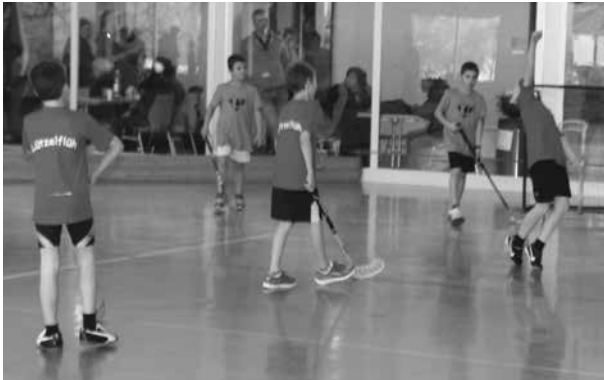
TBOE Unihockeyturnier, Langnau 2013