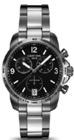
DS Podium - Chronograph