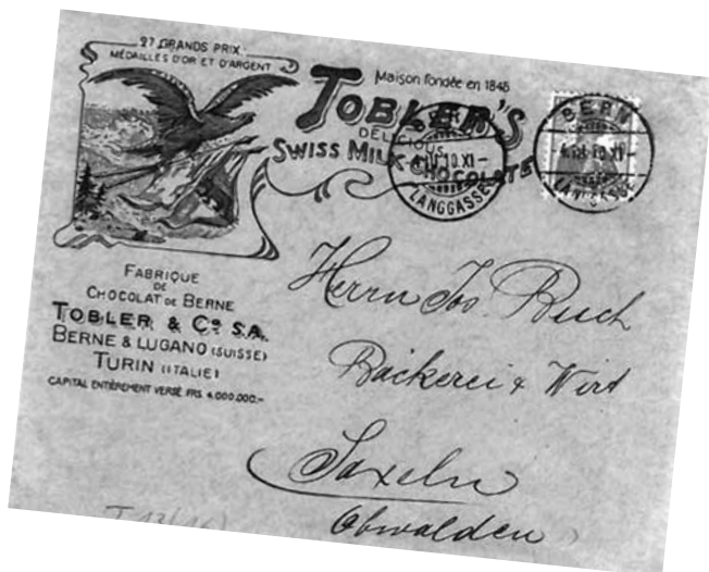
Dekorativer Geschäftsbrief der Firma «Tobler + Cie», Chocolate-Fabrik, Bern, mit Firmenlochung «TOBLER» (siehe auch Einzelmarke mit Lochung)