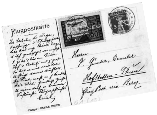
Flugpost-Vorläufer Burgdorf-Bern 30.3.1913 mit Perfinlochung der Firma «Günter + Co AG», Korb und Holzwaren Burgdorf, auf 5Rp., Tellknabe