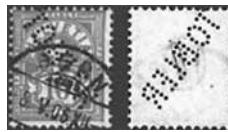
Abgelöste Briefmarke von vorn und hinten mit Perfin-Lochung der Firma «Tobler», Bern, verwendet 1905–1922