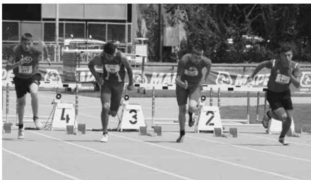
Lokale Ausscheidung UBS Kids Cup, Thun 2014

Die Leichtathletik bietet eine solide Basis in der sportlichen Entwicklung der Jugendlichen. Auch soziale Aspekte werden vermittelt. So lernen sie in diversen Teamwettkämpfen zusammenzuarbeiten und so den Teamgeist zu fördern. Zusätzlich finden während dem Jahr Wettkämpfe statt, um sich in verschiedenen Disziplinen zu messen.