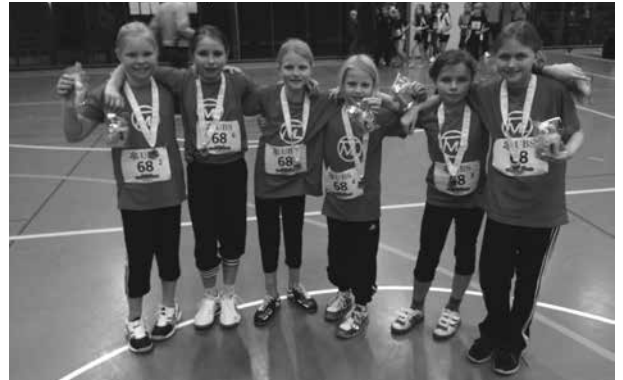
Kids Cup Team, 2013