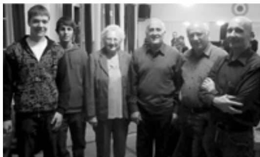
Die am Vereinskongress vom 5.11.2009 geehrten Personen (Bericht auf Seite 15) von links nach rechts:

Noch nicht gemeldete Anlässe der zweiten Jahreshälfte 2010 können der Gemeindeverwaltung bis Ende April 2010 mitgeteilt werden. Diese werden in der Ausgabe von "Lützelflüh aktuell" vom Mai 2010 veröffentlicht.