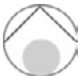
Logo regionaler Sozialdienst Amt Trachselwald

Die Bezirksreform stellt das Gebiet des Regionalen Sozialdienstes Amt Trachselwald in Frage, weil es dieses Amt ab 1.1.2010 nicht mehr geben wird. Die neue Gebietsaufteilung wird uns mit Sicherheit herausfordern.