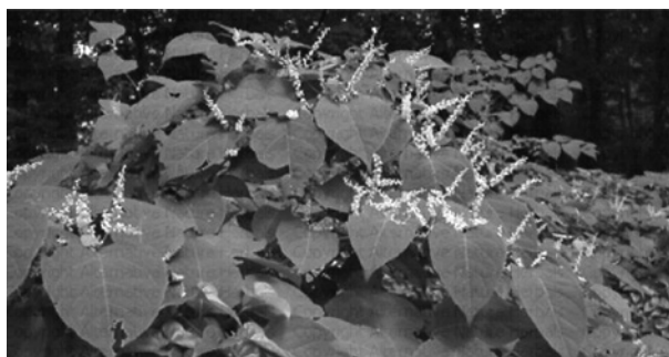
Japanischer Staudenknöterich mit Blüten

Zu den gefundenen invasiven Arten in Lützelflüh gehören: Japanischer Staudenknöterich ( Fallopia japonica ), Drüsiges Springkraut ( Impatiens glandulifera ), Kanadische Goldrute ( Solidago canadensis ), Riesen-Goldrute ( Solidago gigantea ), Robinie ( Robinia pseudoacacia ) und Einjähriges Berufskraut ( Erigeron annuus ). Die letzten beiden werden hier aus Gründen der Unsicherheit nicht behandelt.