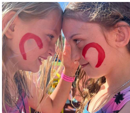
Freundinnen im Schminkzelt: Kinder- und Jugendfäscht!

Als Abschluss an die Schulung der neuen Jungleiter:Innen, fand dieses Jahr wieder ein «Jungleiter:Innen-Weekend» statt. Dieses Jahr durfte das Jugendwerk 17 neue engagierte Jugendliche ausbilden. 15 davon, sind bis heute dabei geblieben und unterstützen die Jugendarbeit tatkräftig bei den Kinderangeboten, den Projekten und Lagern und dem Jugendtreff.