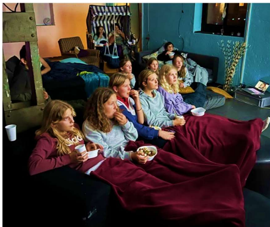
Den Abend des Jungleiter*innen Weekends mit einem Film ausklingen lassen.

Lehnen Sie sich, wie unsere Jugendlichen auf dem Bild unten, zurück und lassen Sie sich auf die abwechslungsreiche bunte Welt des Jugendwerks Lützelflüh ein.