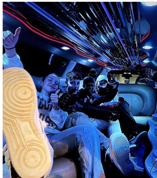
Jugendliche in der Limousine!

Jugendlichen konnten sich gegenseitig challengeen und die Räumlichkeiten erhielten dadurch wieder einmal einen modernen Tupper. Weiter ging es mit Angeboten wie «Color Splash» oder einer «Sport-night» in Grünenmatt. Diese fand leider wenig Anklang bei den Jugendlichen. Deshalb hielten wir weiterhin am Freitagstreff fest. Um den sportlicheren Jugendlichen eine Freude zu bereiten, stellten wir für einen Jugendtreff eine gesamte Skate Anlage auf. Weitere Abende hatten das Thema «Movie Night» oder «Hello Summer». Zusammen erlebten wir viele schöne, aber auch herausfordernde Momente. Zu den Highlights jedoch, dürften wir alle einer Meinung sein, dass der Abend in der Limousine oben auf der Liste steht. Mit seinen Freunden in der Limo sitzen und zu seinem Lieblings Song mitsingen und feiern. Wer hat das nicht auch auf seiner to-do Liste.