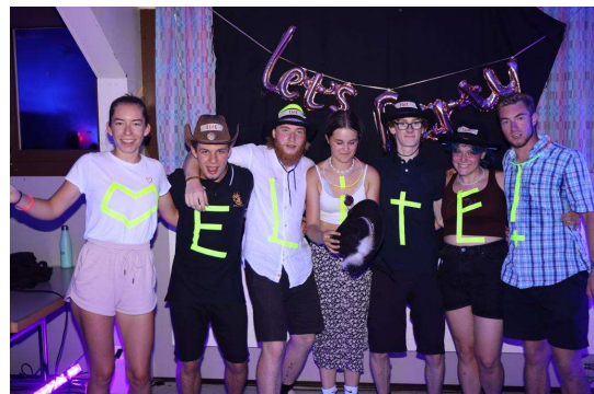
Motivierte, erfahrene Teamler*innen!

Auch ohne die Hilfe der freiwilligen Jugendlichen ginge es nicht: Im Jahr 2022 leisteten die Freiwilligen über 1200 Stunden ehrenamtliche Arbeit. Ein riesiges Kompliment und herzlichen Dank dafür!